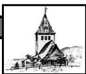
St. Jodokus Bad Oberdorf