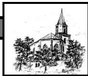
St. Johannes Bad Hindelang

der katholischen Pfarreiengemeinschaft Bad Hindelang