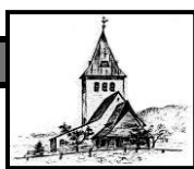
St. Jodokus Bad Oberdorf