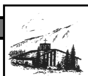
Heilig Geist Oberjoch