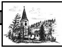
Heiligste Dreifaltigkeit Unterjoch