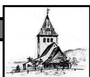
St. Jodokus Bad Oberdorf