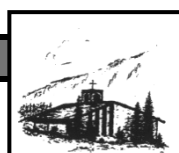
Heilig Geist Oberjoch