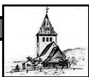
St. Jodokus Bad Oberdorf