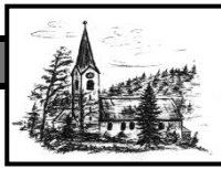
Heiligste Dreifaltigkeit Unterjoch