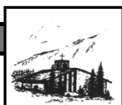
Heilig Geist Oberjoch