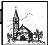
St. Antonius Hinterstein