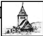
St. Jodokus Bad Oberdorf