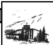
Heilig Geist Oberjoch