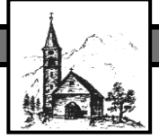
St. Antonius Hinterstein