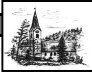
Heiligste Dreifaltigkeit Unterjoch