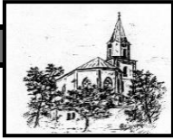
St. Johannes Bad Hindelang

der katholischen Pfarreiengemeinschaft Bad Hindelang