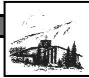
Heilig Geist Oberjoch