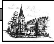
Heiligste Dreifaltigkeit Unterjoch