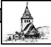
St. Jodokus Bad Oberdorf