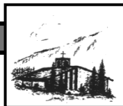
Heilig Geist Oberjoch