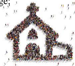
Lebendige Kirchengemeinde

Täglich mit Jesus gehen, nicht feiertäglich nur zuschauen.