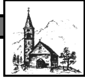
St. Antonius Hinterstein