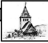
St. Jodokus Bad Oberdorf