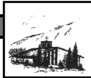
Heilig Geist Oberjoch