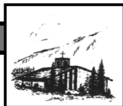
Heilig Geist Oberjoch