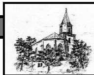
St. Johannes Bad Hindelang

der katholischen Pfarreiengemeinschaft Bad Hindelang