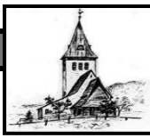
St. Jodokus Bad Oberdorf