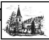
Heiligste Dreifaltigkeit Unterjoch