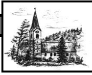
Heiligste Dreifaltigkeit Unterjoch