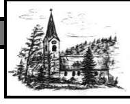
Heiligste Dreifaltigkeit Unterjoch