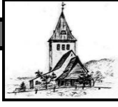
St. Jodokus Bad Oberdorf